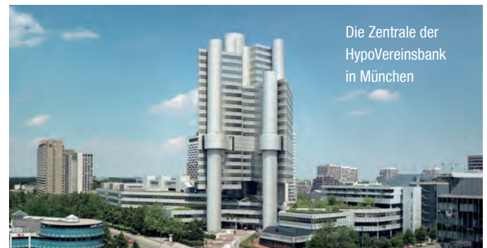
Die Zentrale der HypoVereinsbank in München

zu Anzahlungen beziehungsweise Kautionszahlungen, keine eigene Liquidität. Diese kann dadurch wiederum im wichtigen Kerngeschäft des Unternehmens gewinnbringend eingesetzt werden.