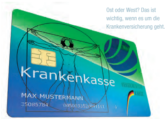
Ost oder West? Das ist wichtig, wenn es um die Krankenversicherung geht.

In Transferprojekten, in denen die Mitarbeiter das so genannte Transfer-Kurzarbeitergeld beziehen, spielt die Beitragsbemessungsgrenze in der Sozialversicherung eine wichtige Rolle. Dabei stellt sich die Frage, welche Beitragsbemessungsgrenze zugrunde zu legen ist: Ost oder West?